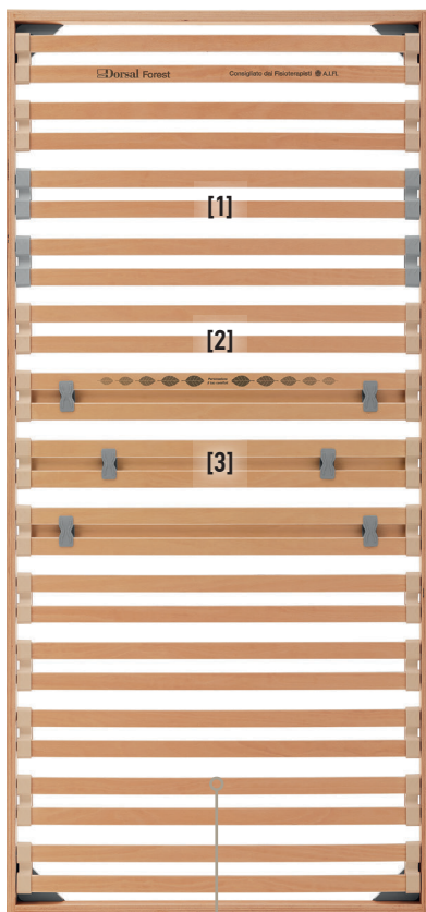
Doghe Dorsal a 7 strati

Cursori regolabili permettono di personalizzare la risposta elastica della zona dorsale secondo le esigenze individuali. Per aumentarne la rigidità si indirizzano i cursori verso il decoro a foglie centrali più scure, per ridurla verso le foglie più chiare.